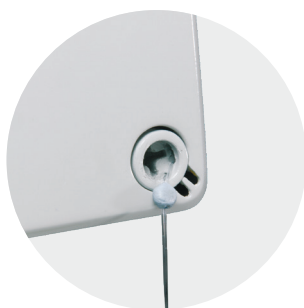
Możliwość plombowania pokryw