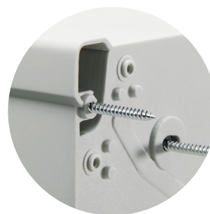
Różne możliwości montażu na ścianie