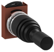
P9MMN2A Z uchwytem

Manipulatory – 2-pozycyjne i 4-pozycyjne